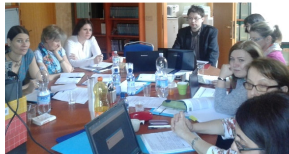
Pierwsze spotkanie partnerów w Carpi/IT

Aby w znaczący sposób przyczynić się do zwiększenia integracji rynku pracy rodzinnych opiekunów osób starszych partnerstwo projektu ELMI , w którego skład wchodzi organizacje z Włoch, Rumunii, Austrii, Czech i Polski, oferuje im podniesienie kwalifikacji w oparciu o kurs e-learningowy, który zostanie przeniesiony z Włoch do Rumunii, co umożliwi nie tylko zdobycie cennych informacji związanych z rolą nieformalnych opiekunów, ale również da im solidne przygotowanie, jako bazę przy szukaniu pracy w sektorze opieki.